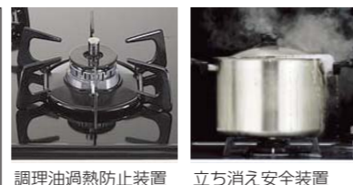
調理油過熱防止装置 立ち消え安全装置