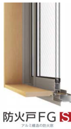
防火戸 FG-S アルミ構造の防火窓